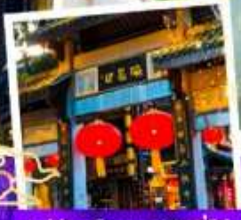
หมู่บ้านโบราณฉือเซ่เซว่