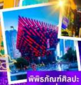
พิพิธภัณฑ์ศิลปะ ลงชิง