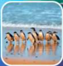
เพนกวินที่เกาะฟิลลิป