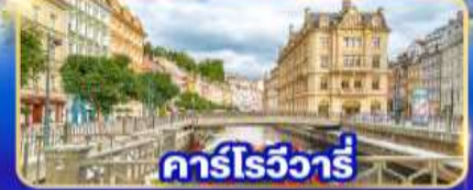
คาร์โรวี่วารี