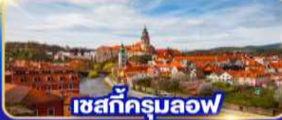
เซสท์ครุมลอฟ