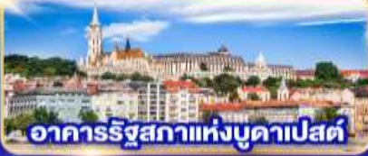
อาคารรัฐสภาแห่งบูดาเปสต์