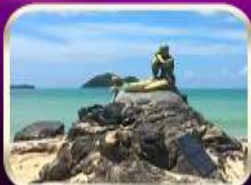
เที่ยวหาดสมิหลา สงขลา