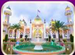
ชมมัสยิดกลางปัตตานี