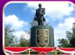
อนุสาวรีย์กรมหลวงชุมพรฯ