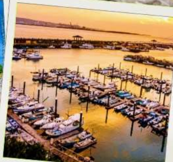
ท่าเรือประมงตั้นสุ่ย